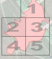
СХЕМА СОВМЕЩЕНИЯ ФРАГМЕНТОВ