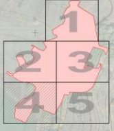
СХЕМА СОВМЕЩЕНИЯ ФРАГМЕНТОВ