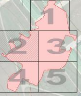
СХЕМА СМЕЩЕНИЯ ФРАГМЕНТОВ